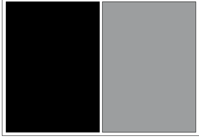
Halbe Seite Format: 152 mm x 109 mm